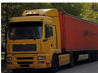
D - [ ]