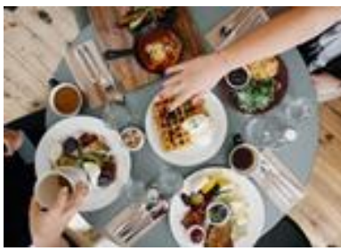
G - [ ]