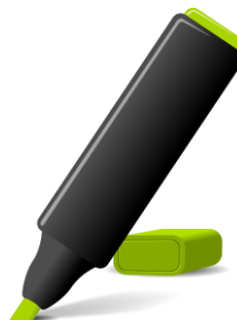
B - [ ]