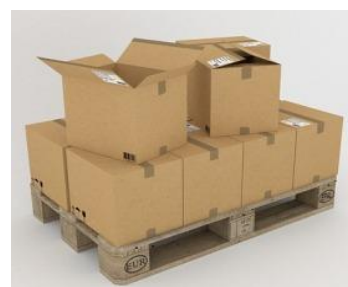
E - [ ]