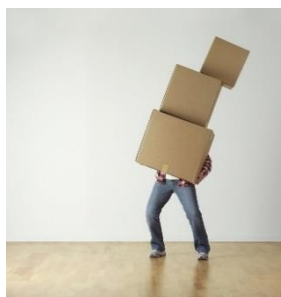
J - [ ]