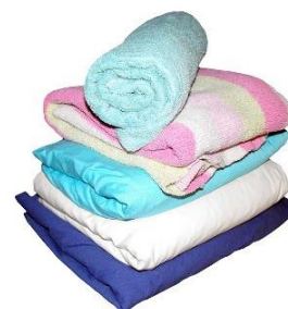
H - [ ]