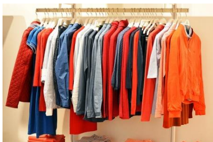
F - [ ]