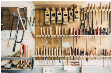
A - [ PRZYKŁAD ]

Proszę wysłuchać tekstów o sposobach organizacji przeprowadzki i dopasować numer tekstu do ilustracji.