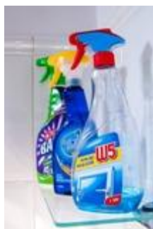
I - [ ]