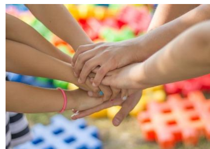
K - [ ]